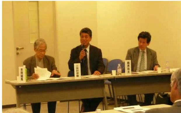
質問に答える先生方

当日は 80 名の参加者からの多くの質問がありましたが、時間的制約のためすべての方の質問にお答えしていただく時間はありませんでしたので、交流会において活発な議論がなされました。